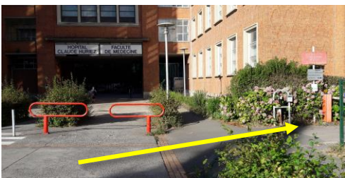
C : Entrée de l'Hôpital Huriez