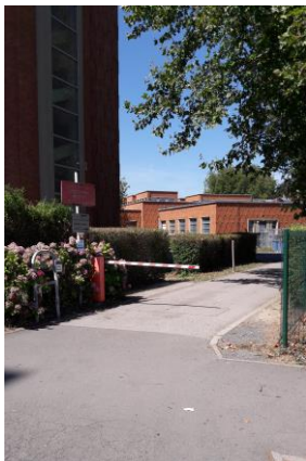
D : Entrée parking du bâtiment de recherche