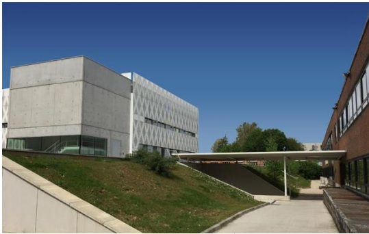
SPQI – 4BioDx