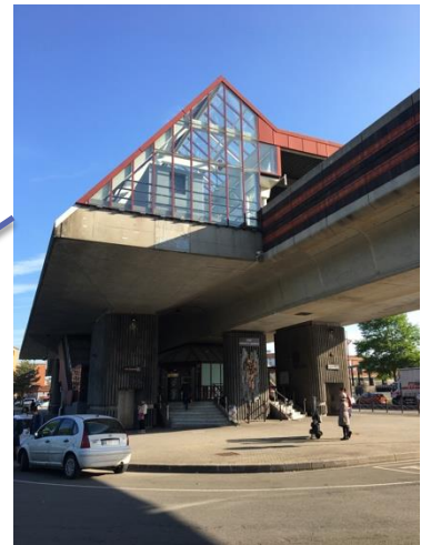
A : Métro CHU Centre Oscar Lambret