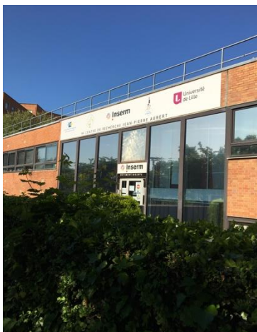
B : Inserm, Centre de Recherche Jean-Pierre Aubert