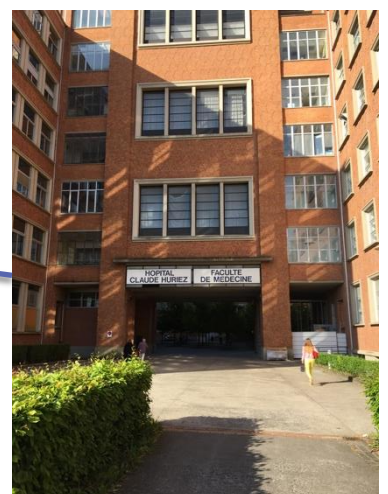
C : Entrée de l'hôpital Huriez